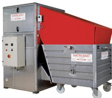
ベルト式スラッジドライヤ