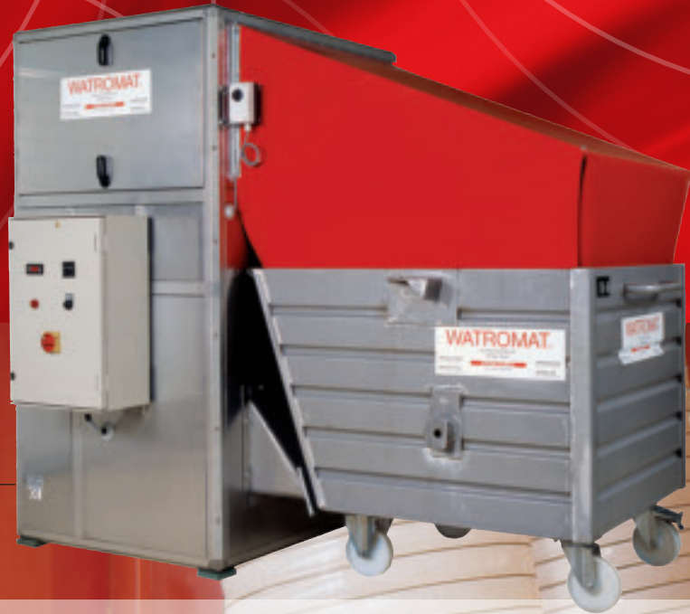
WATROMAT® 200S sušara za mulj sa prihvatnim kontejnerom (kapacitet isparavanja 200 l/dan vode)