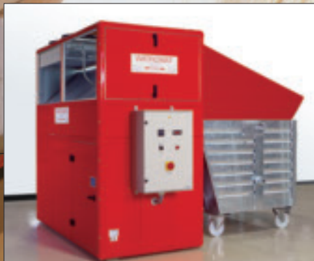
WATROMAT® 1600S sušara za mulj sa prihvatnim kontejnerom (kapacitet isparavanja 1600 l/dan vode)