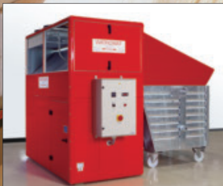
WATROMAT® 1600S 污泥干燥机和污泥储柜 (蒸发量1600升/日水)