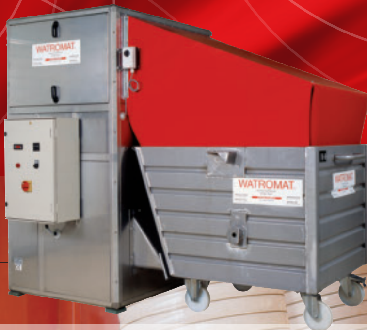
WATROMAT® 200S 干燥空气产生器及污泥储柜 (蒸发量200升/日水)