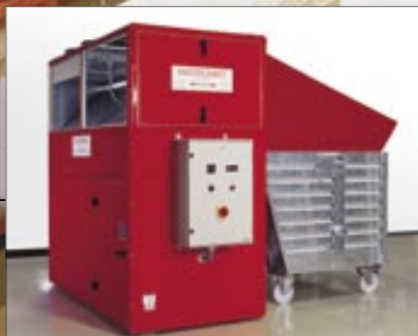
WATROMAT® 1600 Penjana udara nyahair dengan kontena enapcemar (Kapasiti sejatan 1600 Liter; 3600 lbs/hari air).