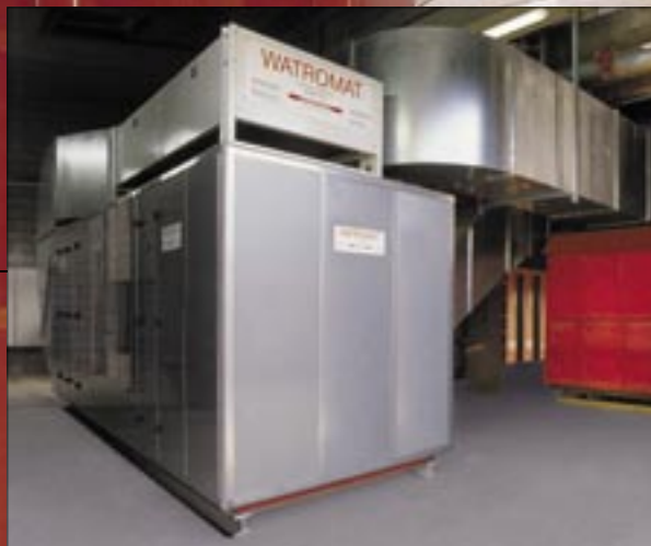
WATROMAT® 6000 Penjana udara nyahair dengan kontena enapcemar 30 m³; 840 ft³ (kapasiti sejatan 1600 Liter; 3600 lbs/hari air)