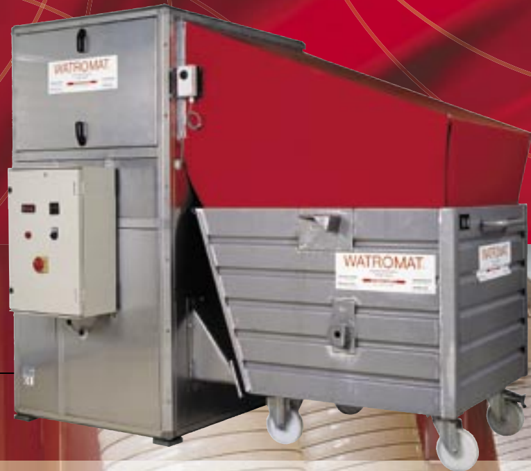
WATROMAT® 200 Penjana udara nyahair dengan kontena enapcemar (Kapasiti sejatan 200 Liter; 440 lbs/hari air).