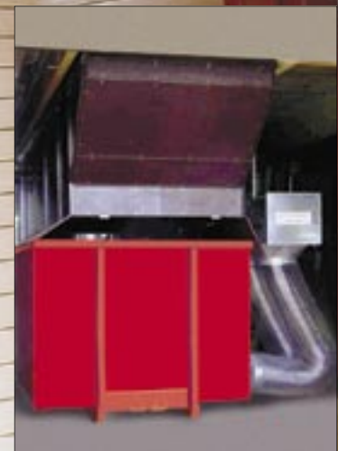
WATROMAT® 20000 Penjana udara nyahair dengan Lingkaran penyahairan terowong berterusan (kapasiti sejatan 20000 Liter; 44 000 lbs/hari air)